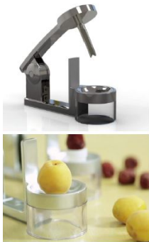
과육 손상 없이 쉽게 씨앗만 제거(그린팜텍)