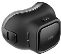
IoT 방음 디바이스를 적용한 마스크(동동)