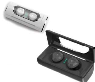
러너를 위한 음성지원 이어셋(런스타)