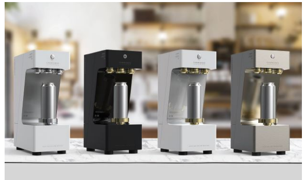
커스터마이징 푸드 브랜딩 패키지 솔루션(퀵웍스)