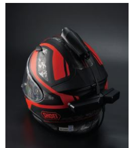
헬멧 부착형 CMS 스마트 디바이스(올프스)